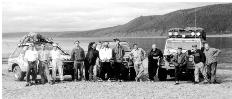
▲ Команда «Сибирского марафона» на берегу Енисея. Снимок на память

Б езымянка – первая большая деревня на нашем пути. Раскинулась на пригорке вдоль речки Безымянная. Нежнозеленые берега, бревенчатый мост, лодки в камышах, аккурат-