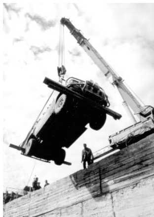
▲ Погрузка на баржу в поселке Ярцево, Красноярский край