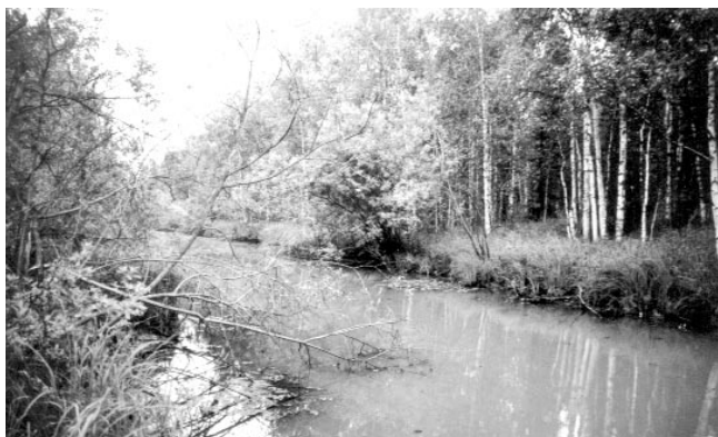
▲ Заросший соединительный канал