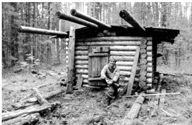
▲ Охотничья избушка на р. Лобаниха

скую заимку. Таким образом, у нас появился стимул прорываться быстрее вперед, пока не вышел запас.