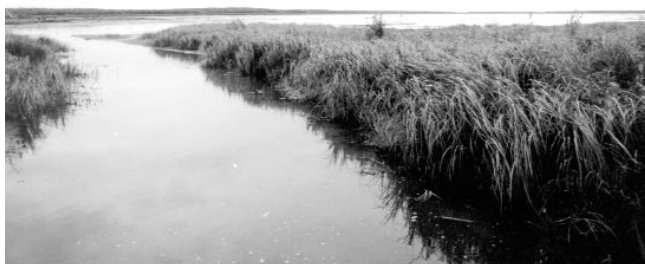
▼ Водораздельное озеро и место соединения с каналом

ет самым причудливым образом. В одном месте – небольшой ручей, бегущий между высокими берегами, в другом – большие омуты со спокойной, зеркальной водой. Где-то недалеко Водораздельное озеро. До староведов на Казанцевской – «рукой подать».