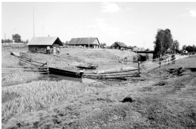
▲ Казанцевская заимка и шлюз Касовский рядом с границей Томской области и Красноярского края

О днако весь следующий день проводим на Николаевском. С помощью походного сварочного аппарата завариваем разбитый кожух коробки. Получается: масло не бежит. Проводим разведку предстоящей дороги. С помощью пил и топоров зачищаем кустарники, разбираем завалы. Уходим примерно на четыре километра. Сюда же к вечеру следующего дня перегоняем две ма-