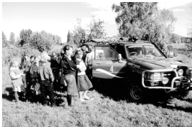
▲ Деревня Безымянка (Красноярский край). Любопытные ребятишки

П ришло время отправляться в дорогу. Благодарим гостеприимных хозяев за теплый прием.