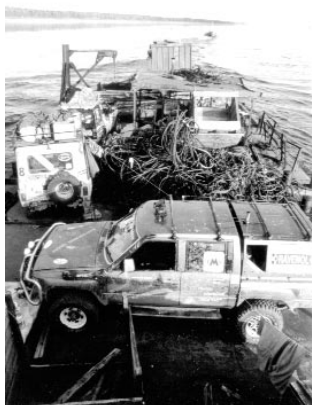
▲ На барже по Енисею

Вдали показались сопки – там Енисей. Через несколько часов наши грязные машины, поднимая фонтаны брызг, влетают в воды великой сибирской реки. У Енисея хмурое настроение, у нас же – наоборот, радостное и восторженное. Кажется, оно передается и самой природе. Сквозь серые тяжелые облака пробиваются ласковые лучи солнца. Ничего не понимающие жители соседней деревни Фомка наблюдают за нами. Мы похожи на ненормальных, но нам все равно,