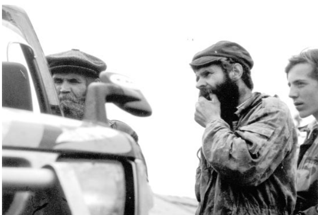
▲ Староверы перед невиданной техникой (д. Безымянка)

Покидаем Безымянку, увозя в сердце частичку душевного тепла от общения с открытыми, добрыми, сильными в вере людьми.