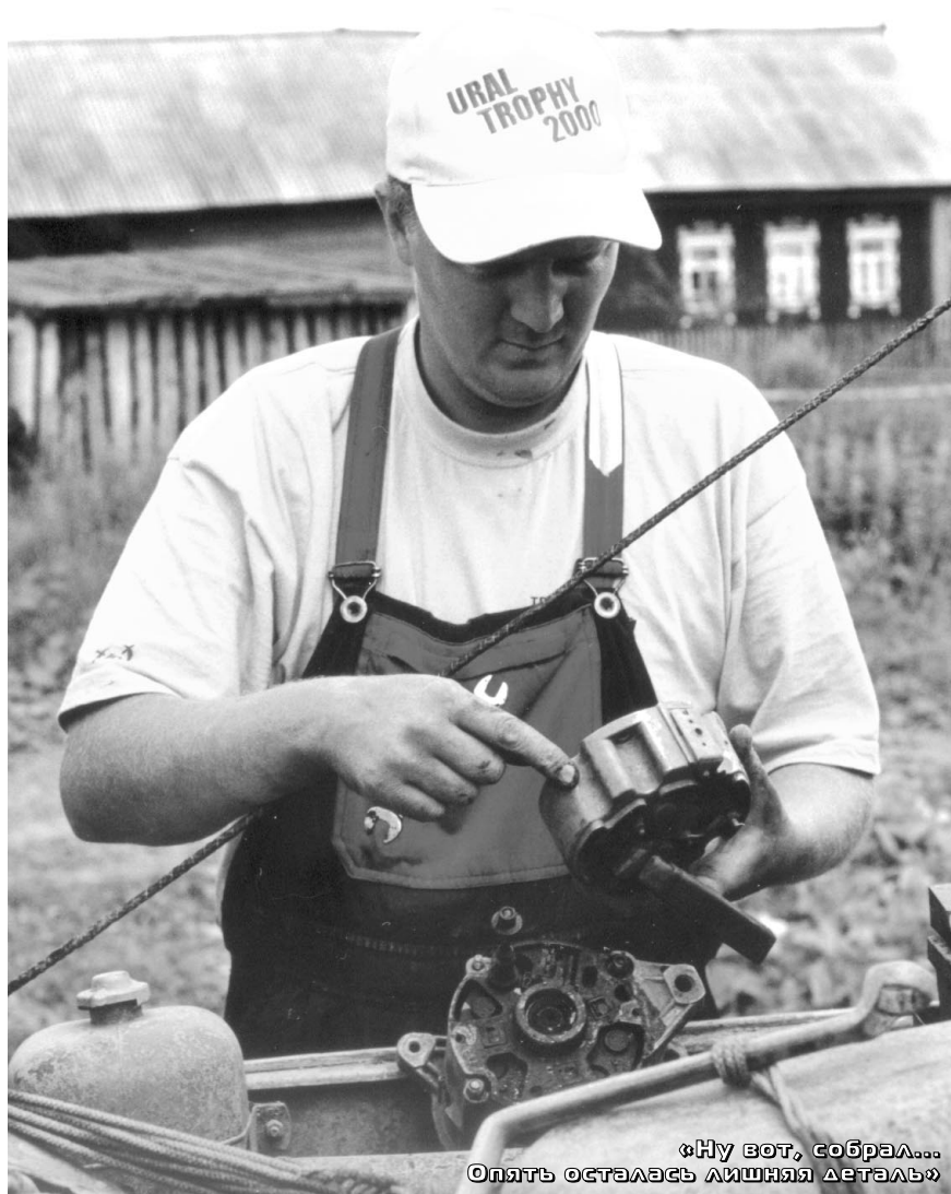
«Ну вот, собрал... Опять осталась лишняя деталь»

может произвести сильное впечатление на любого автослесаря – это сгоревшее сцепление на ISUZU, пробитый радиатор на УАЗике «Скромного», лопнувшая рессора на TOYOT'e «Дяди Саши», погнутая рулевая тяга на УАЗике «Бывалого» и много других по мелочам.