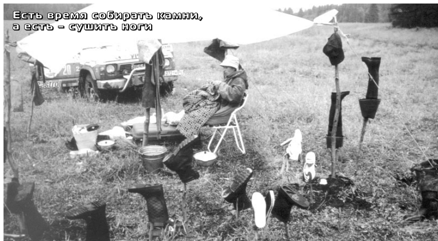
Есть время собирать камни, а есть – сушить ноги

может произвести сильное впечатление на любого автослесаря – это сгоревшее сцепление на ISUZU, пробитый радиатор на УАЗике «Скромного», лопнувшая рессора на TOYOT'e «Дяди Саши», погнутая рулевая тяга на УАЗике «Бывалого» и много других по мелочам.