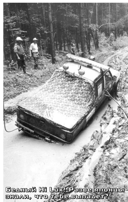
Бедный Hi Lux! Разве японцы знали, что тебе выпадет?