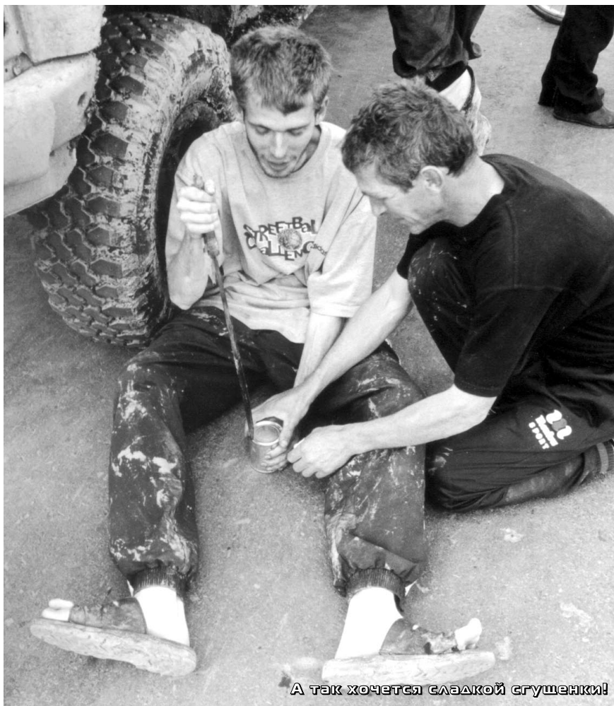
А так хочется сладкой сгущенки!