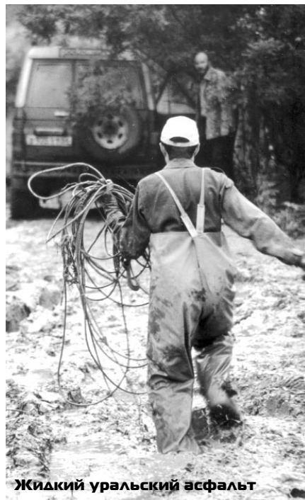
Жидкий уральский асфальт

Обсудив командой создавшуюся ситуацию, мы высказываем свои пожелания организатором этим же вечером. Предлагаем создать подгруппу «В» – класс туризм. «А» – соответственно остается за «спортсменами». «Туристы» пойдут по той же легенде, через те же спецучастки с одной лишь разницей – не на время. Однако наше предложение вызывает у организаторов неадекватную, агрессивную реакцию.