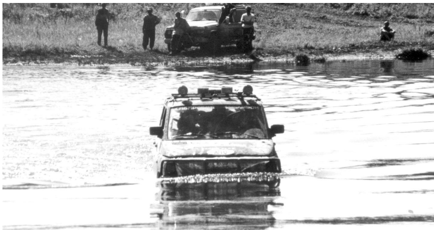
Таких бродов было много

Вроде бы это взаимное компромиссное решение, но с этого момента участники «Сибирского марафона» становятся вдруг врагом номер один для организаторов «Урал-трофи». Иначе никак не объяснить того, что на следующий день в СМИ Екатеринбурга они стали заявлять, что новосибирские участники испугались трудностей и покинули пределы Урала(?!). Совершенно случайно узнав об этой «утке» от ничего не понимающих участников, с которыми мы успели подружиться, выслу-