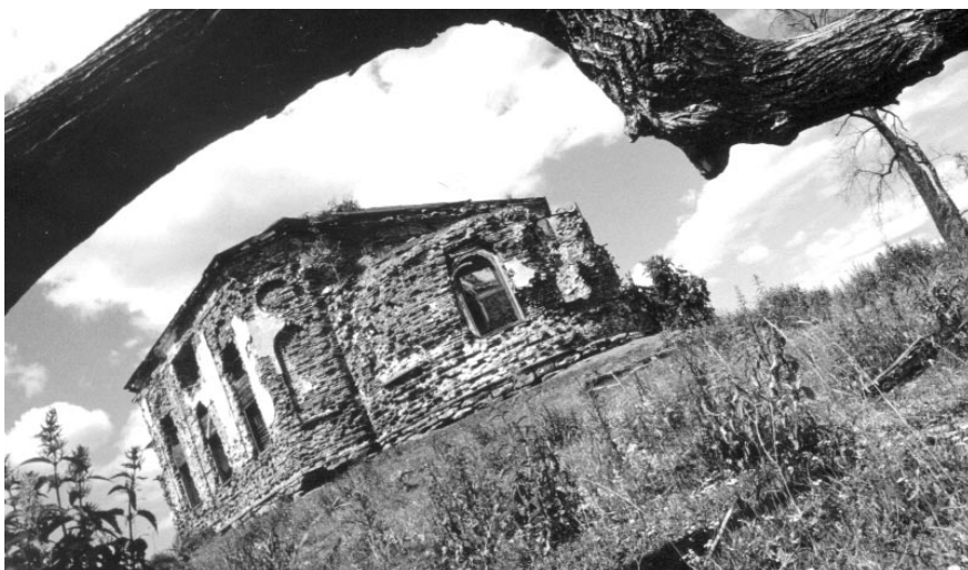
Полуразрушенная церковь в деревне Молебка

Все участники, в том числе и новосибирцы, были удостоены почетных грамот, подтверждающих, что многотрудный путь был пройден ими с честью. Теперь – дорога домой – третий, заключительный этап нашего путешествия. Уже не торо-